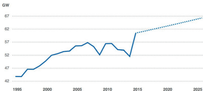
Figura 1: Scenario di sviluppo della richiesta di potenza elettrica annua

Come rappresentato nel diagramma sottostante, nei prossimi anni si prevede una forte accelerazione dell'elettificazione dei consumi e un aumento esponenziale del fabbisogno di potenza elettrica da parte dei cittadini per nuovi servizi (es. impianti di condizionamento o mobilità elettrica).